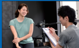
③見学後、施設の詳細についてご不明な 点がございましたら、お気軽にお尋ね ください。