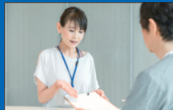
①フロントにて受付

ご利用目的やご利用時間などを伺った上で、お客様のご要望に合わせてご案内いたします。