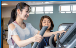
②お客様のご要望に合わせて何でも ご相談ください。 スタッフが施設をご案内いたします。